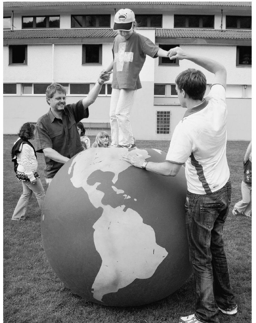
Unterwegs auf dem Erdball.