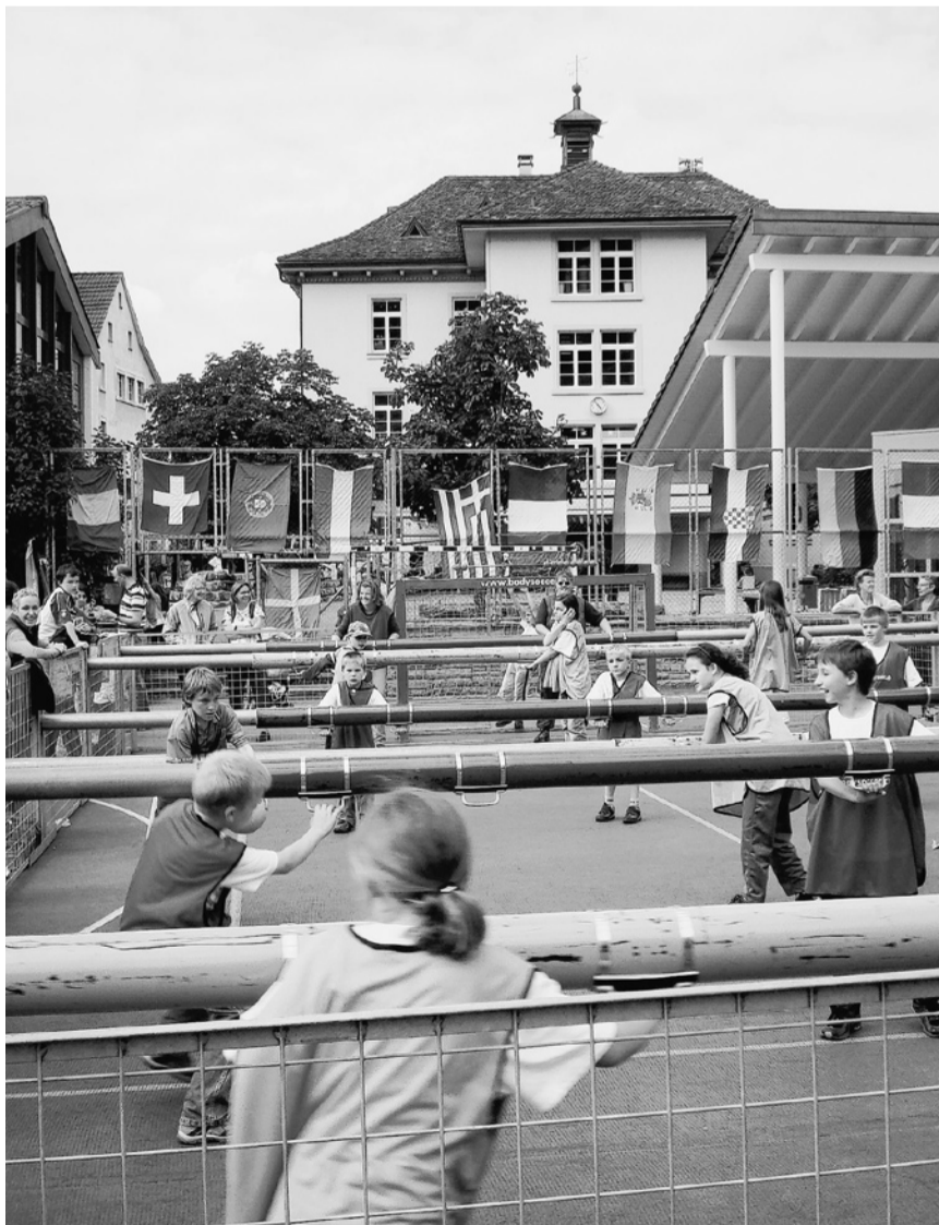
Der Bodysoccer als Attraktion am Ormalingen Schulfest.